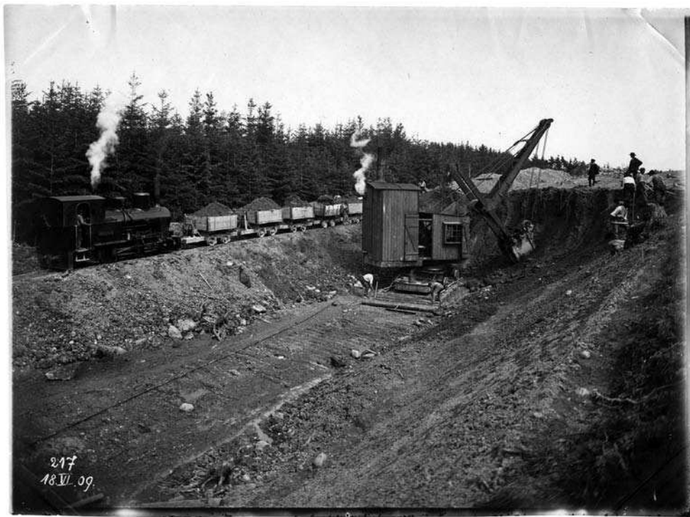
Löffelbagger an der Arbeit in der Nähe von Roggwil.